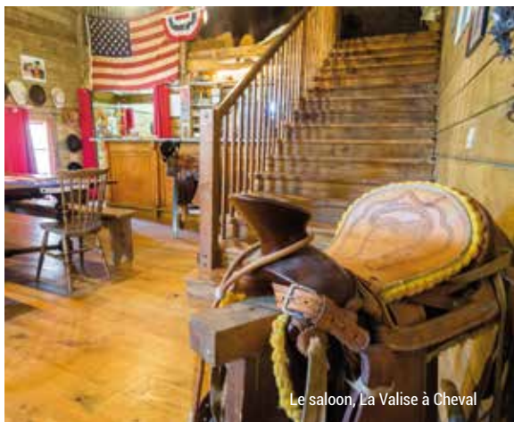
Le saloon, La Valise à Cheval