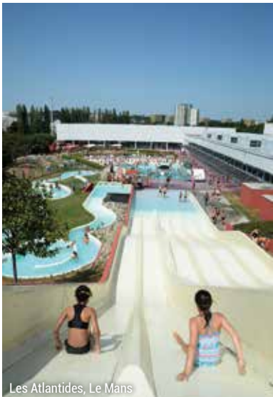
Les Atlantides, Le Mans