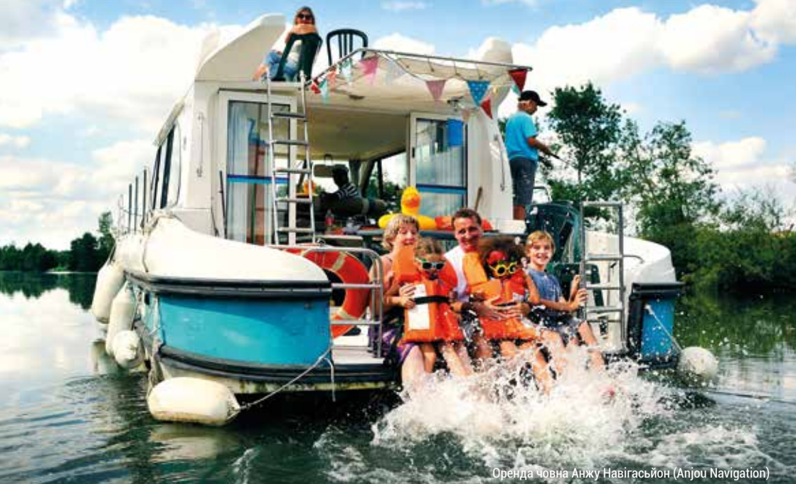
Оренда човна Анжу Навігасьйон (Anjou Navigation)