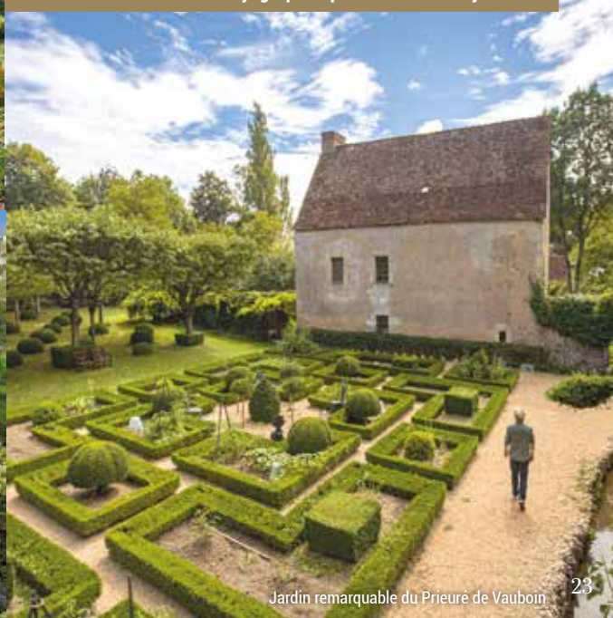
Jardin remarquable du Prieuré de Vauboin

Побачити сади ви зможете за посиланням: www.sarthetourisme.com/voyage-poetique-au-coeur-des-jardins