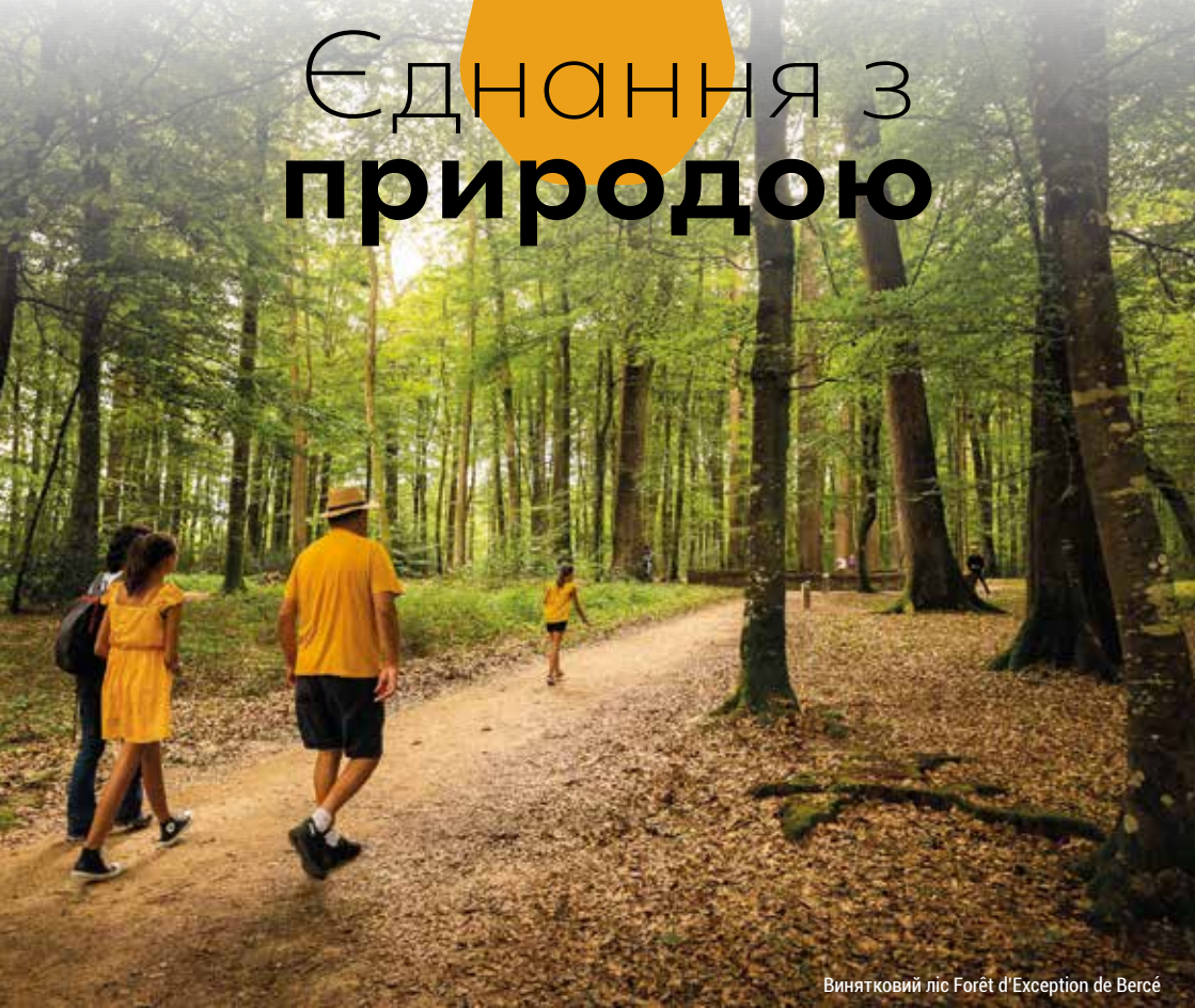
Винятковий ліс Forêt d'Exception de Bercé

Ліси, гаї, річки і невеликі гори створюють надзвичайний ландшафт Сарту. Така різноманітність подарує справжній відпочинок любителям природи.