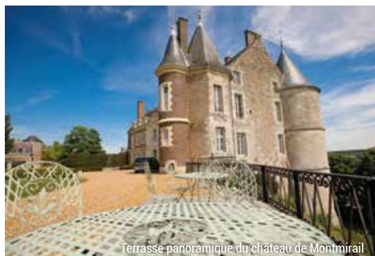
Terrasse panoramique du château de Montmirail