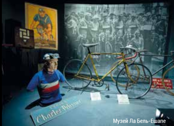
Музей Ла Бель-Ешапе

Зверніть увагу на 10 музеїв, що належать до групи "Sarthe Musées". Музеї фаянсу і кераміки (musées de la Faïence et de la Céramique), музей механічної музики (de la Musique Mécanique), музей Другої світової війни композитора Роже-Беллона (de la 2e Guerre mondiale Roger-Bellon), музей головних уборів (de la Coiffe), ливарний цех Антуаньє (La Fonderie d'Antoigné), Ла Бель Ешапе (La Belle Échappée), музей дерева і людини (Carnuta), музей культурної спадщини (le Manoir de la Cour) і художній центр (l'Espace Bézard).