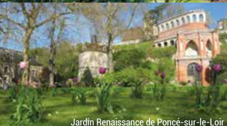
Jardin Renaissance de Poncé-sur-le-Loir