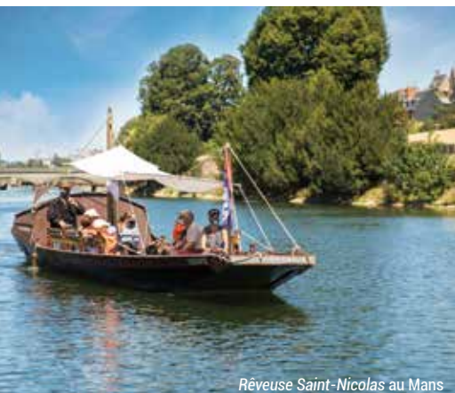
Réveuse Saint-Nicolas au Mans

https://www.sarhetourisme.com/activites-sportives-culturelles-sejour-itinerant/la-reveuse-de-saint-nicolas