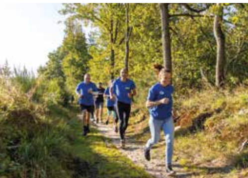
Чемпіонка світу з бігу по бездоріжжю Наталі Моклер