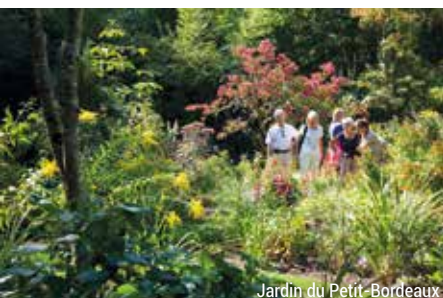
Jardin du Petit-Bordeaux

Вирушайте на прогулянку сімома чудовими садами Ла-Сарту і отримайте насолоду від надзвичайних ландшафтів та архітектури: монастир Вобуен (le prieuré de Vauboin) (який отримав нагороду першого ступеню за Садове мистецтво в 2020 році), сади Де-Балон ( les jardins du donjon de Ballon), сад Пті-Бордо (jardin du Petit-Bordeaux), сад замку Люд (château du Lude), сад замку Мірай (château du Mirail) і сад у стилі ренесансу Понсе-сюр-ле-Луар (Poncé-sur-le-Loir).