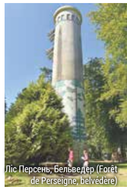
Ліс Персень, Бельведер (Forêt de Perseigne, belvédère)