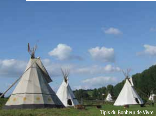
Tipis du Bonheur de Vivre