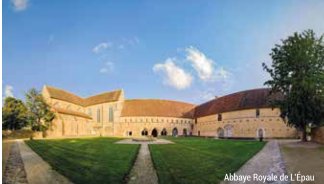
Abbaye Royale de L'Épau