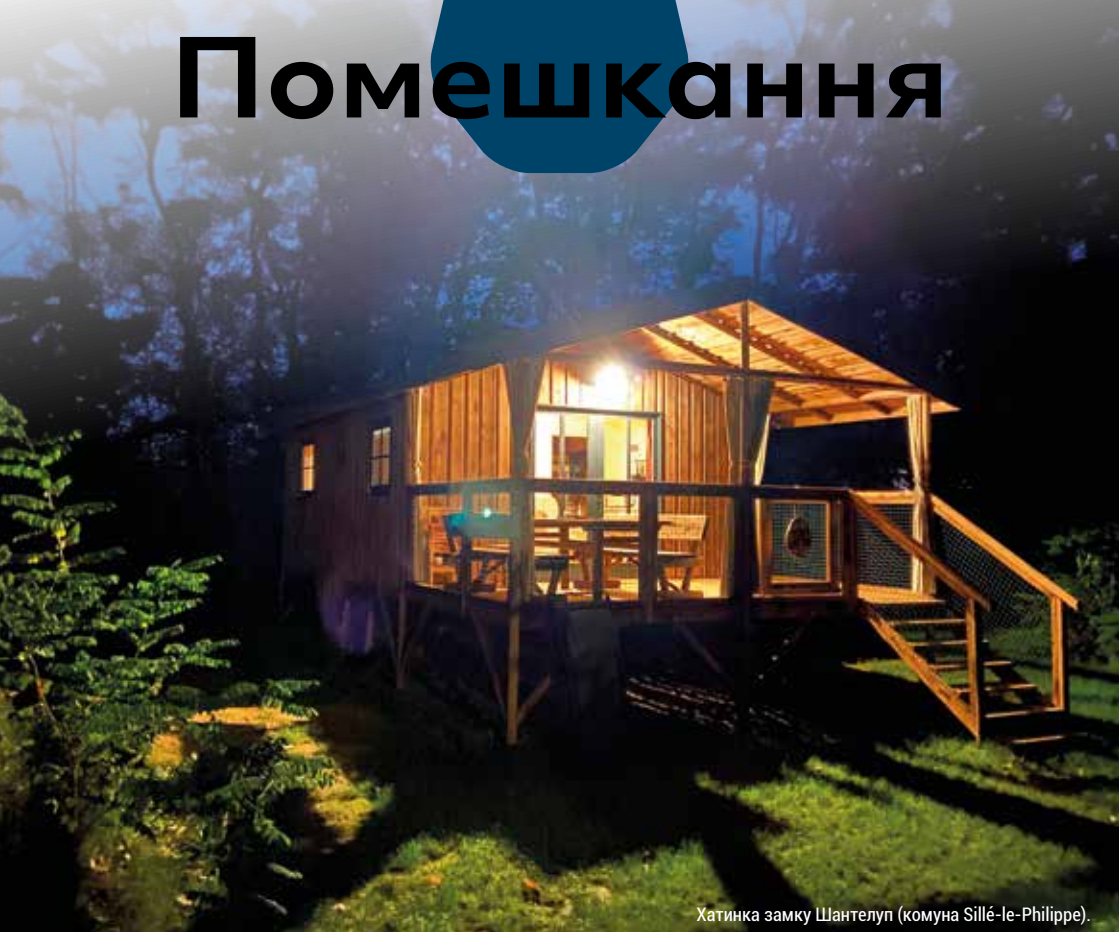
Хатинка замку Шантелуп (комуна Sillé-le-Philippe).

Бажаєте змінити обстановку? Пропонуємо вам декілька незвичайних ідей для ночівлі!