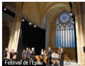
Festival de l'Épau