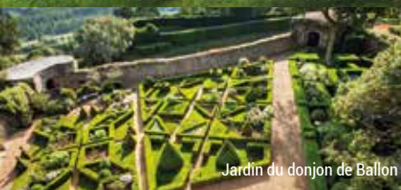
Jardin du donjon de Ballon

Побачити сади ви зможете за посиланням: www.sarthetourisme.com/voyage-poetique-au-coeur-des-jardins