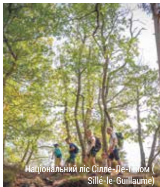
Національний ліс Сілле-Ле-Гіом (Sillé-le-Guillaume)