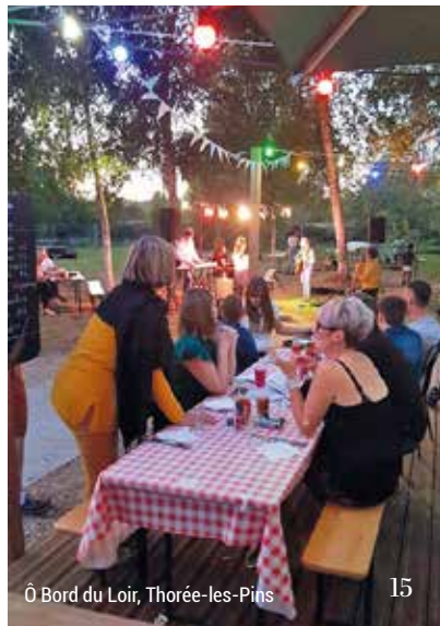
Ô Bord du Loir, Thorée-les-Pins

Ресторан "Des Tanneries", що знаходиться у старовинному кварталі Ле-Ману "Cité Плантагенет" (la Cité Plantagenêt) подарує вам справжній відпочинок на березі річки Сарт. www.facebook.com/Guinguettelemans www.facebook.com/Guinguettelemans