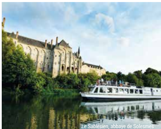
Le Sablésien, abbaye de Solesmes