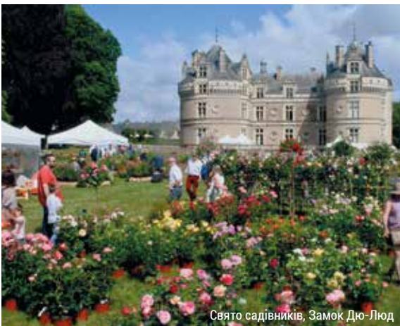
Свято садівників, Замок Дю-Люд