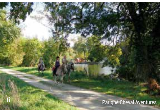
Parigné Cheval Aventures

www.sarthe-tourisme.com/randonnees-equestres